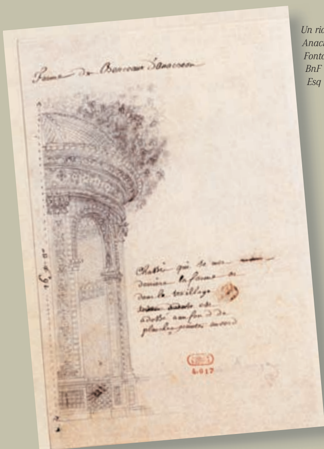
Un rideau pour Anacréon, par Slotz, Fontainebleau, 1754, BnF Opéra, Esq 18 [X, 22]